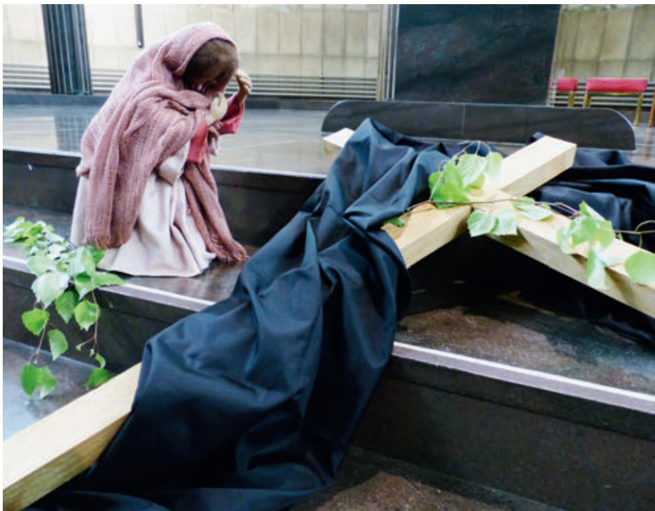
Kreuzerfahrungen, Trauer und Klage gehören zum Leben.