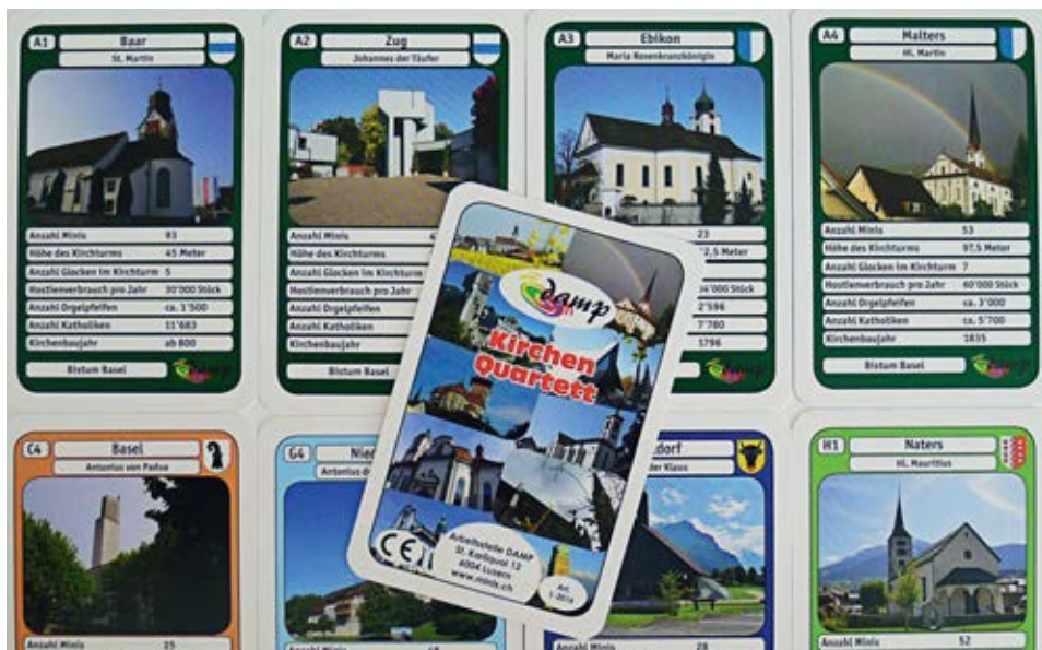
Bruder Klaus, Altendorf, gegen St. Martin Schwyz ist im Kirchen-Quartett ein mögliches Duell.