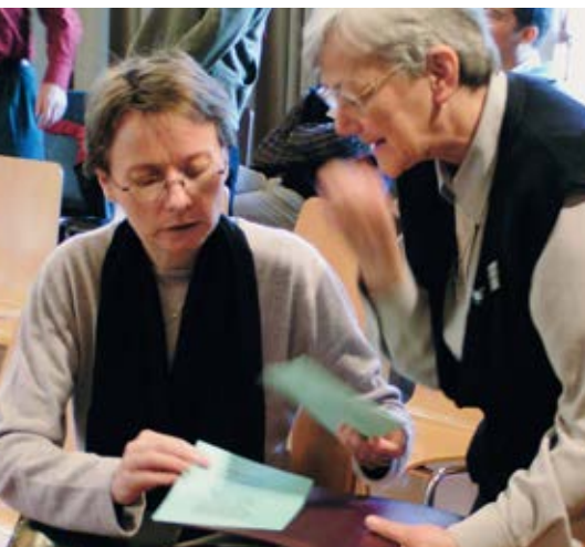
Frauen bewegen schon heute sehr viel in der Kirche.