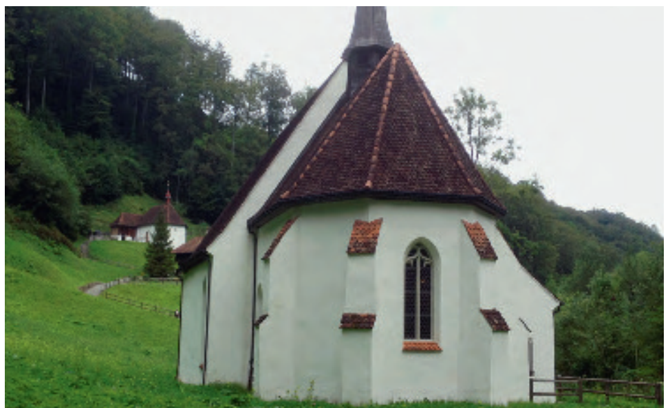
Die untere Ranftkapelle (vorne) und die obere Ranftkapelle mit der Klausen.

* Guido Estermann ist Leiter Fachstelle Bildung-Katechese-Medien der Katholischen Kirche Zug und Dozent an der Pädagogischen Hochschule Schwyz