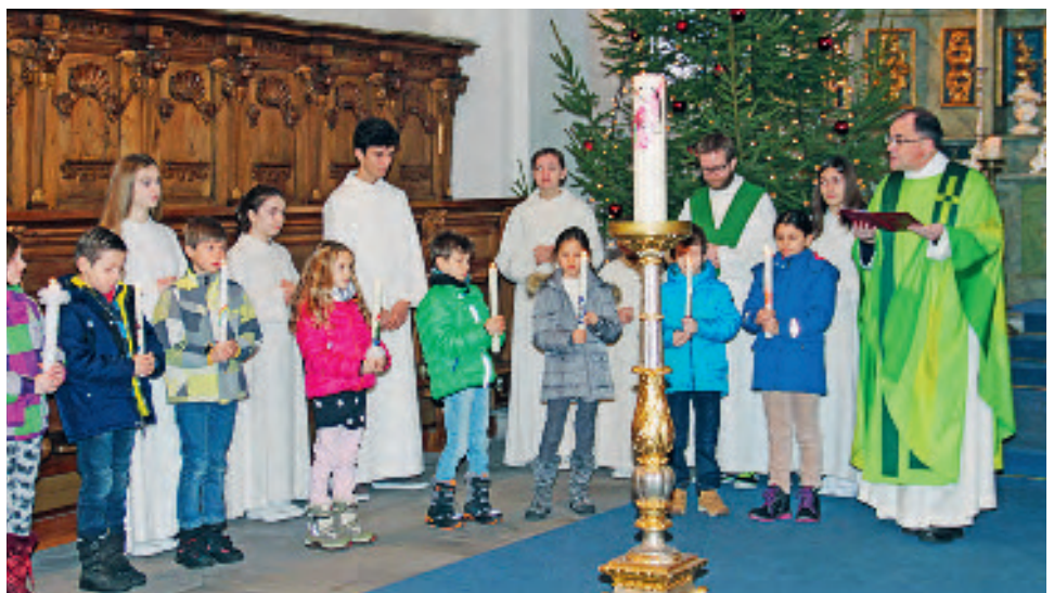
Taufe unserer Erstkommunionkinder im Familiengottesdienst

19.00 PH Dankeschönfest für Ehrenamtliche