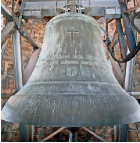
Die grösste Glocke - die Heiligkreuzglocke - im Südturm hat ein Gewicht von über sechs Tonnen.

In früheren Zeiten läutete die Wetterglocke (Nr. 3) vom Markstag (25. April) bis Kreuzerhöhung (14. September) mittags