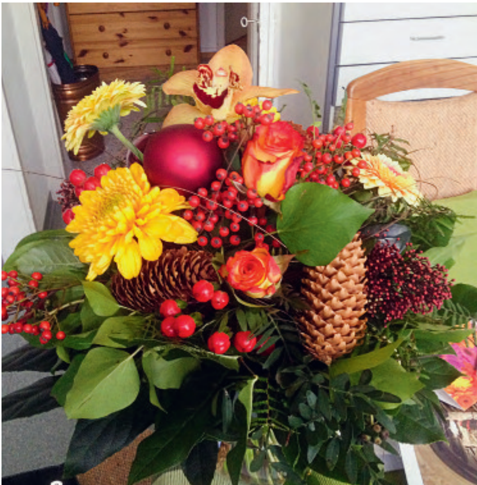
Ein geschenkter Blumenstrauß als ausdrucksstarkes Zeichen der Freundschaft.

Das waren genau die Antworten, die ich gesucht hatte: Selig sind die, die ein reines Herz haben ... die Frieden stiften ... die keine Gewalt anwenden ... die Barmherzigen ... Ja, das sind nach meiner Meinung die sehr viel besseren Empfehlungen, wenn es gilt zu entscheiden, ob ich eine Wahrheit ausspreche oder verschweige – ob dies nun im Rahmen einer Freundschaft geschieht oder nicht.