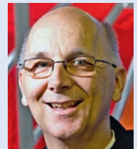
Im Auftrag der Schweizer Bischofskonferenz: Marian Eleganti, Weihbischof des Bistums Chur

Die Suizidraten bei alten Menschen nehmen zu, auch weil Teile der Gesellschaft daran sind, neue Standards zu setzen durch die Rechtfertigung und Legitimierung der Selbsttötung als Versuch der Suizidenten, bis zum Schluss die Autonomie und damit die menschliche Würde zu bewahren. Der christliche Glaube hingegen spricht seit jeher vom Übergang und Heimgang der Verstorbenen und sieht das Leben als eine grosse Bewährungs- und Vorbereitungszeit auf die Vollendung in Gott. Das lässt Christen zuversichtlich auf die Todesstunde blicken.