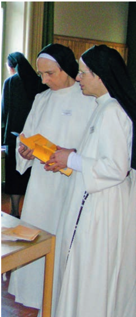
In verschiedensten Ordensgemeinschaften werden die evangelischen Räte gelebt.

Bruder Niklaus formulierte die Grundhaltung des Gehorsams als Horchen, als sensibles Hören auf die eigene innere Stimme und auf die Bedürfnisse des Menschen, der einem begegnet, und auf alle Geschöpfe in ihrer Schönheit und Gefährdung.