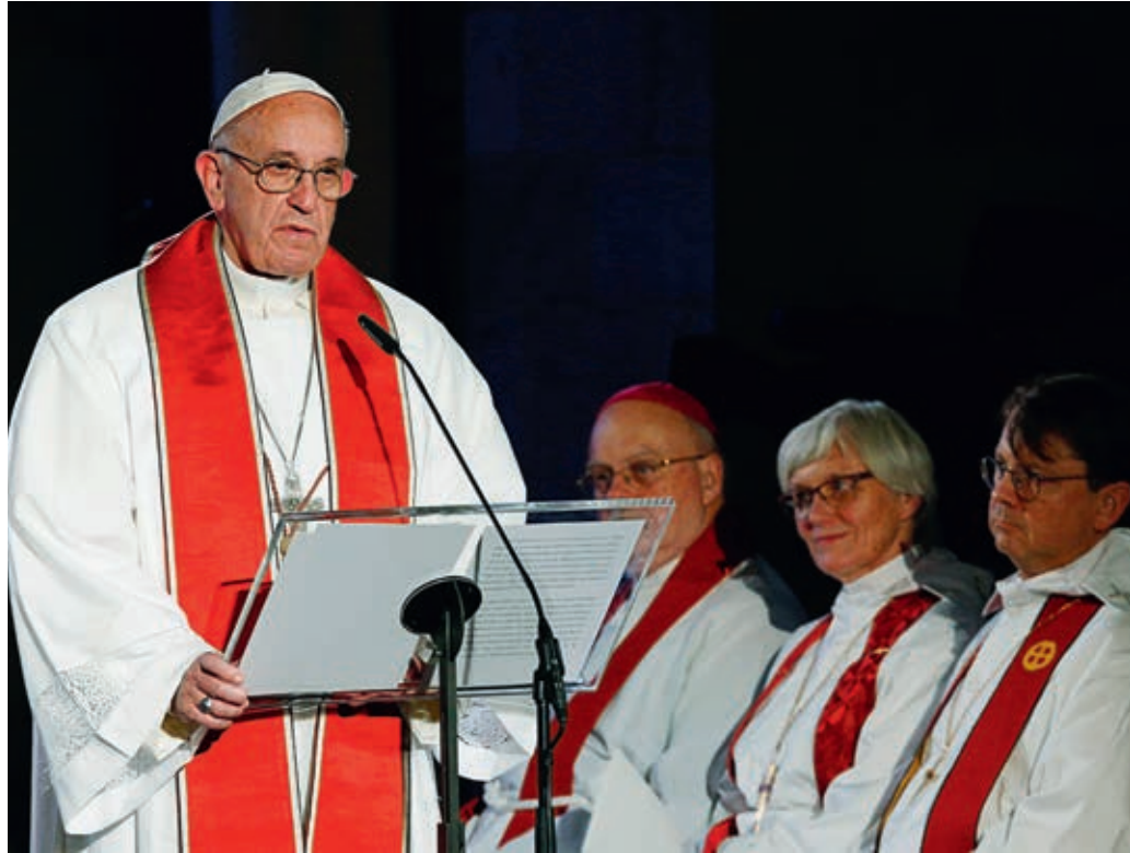
Gottesdienst und Ökumene-Fest mit Papst Franziskus am 31. Oktober 2016 zum Beginn des Reformationsjahres 2017 im Veranstaltungszentrum «Malmö Arena» in Lund.

Dieser Meinung sind auch die Schweizer Bischofskonferenz (SBK) und der Schweizerische Evangelische Kirchenbund (SEK) , die gemeinsam zu mutigen Schritten für mehr Einheit zwischen den Konfessionen aufrufen. Im Jahr 2017 gebe es nämlich neben der 500 Jahre Reformation auch noch etwas Katholisches zu feiern: den 600. Geburtstag von Niklaus von Flüe. Im Zeichen der Ökumene laden die SBK und der SEK am 1. April zu einem nationalen ökumenischen Gedenk- und Feiertag nach Zug ein. Projektleiter und eigentlicher Ideenge-