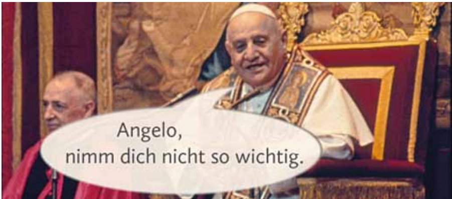
einer der bekanntesten Aussprüche von Johannes XXIII.

Auch wenn es den kleinen Angelo geärgert hat, eigentlich war ihm damals schon klar, dass er Pfarrer werden wollte. Rund 70 Jahre später bestieg er den Petrusstuhl als Papst Johannes XXIII. und vor einem halben Jahr wurde er heiliggesprochen. Zu spät Geborene wie ich können nur noch indirekt nachvollziehen, was es war, das bei den Menschen die Faszination und Begeisterung diesem «Papa buono» (guten Papst) gegenüber auslöste. Es sind seine Gesten und Worte gewesen, seine humorvolle Art, das Gefühl, einen echten Seelenhirten vor sich zu haben. In Italien gibt es heute in fast jeder Stadt eine Strasse Giovanni XXIII, ein Zeichen dafür, dass er es war, der es schaffte, das Papsttum, das sich im 19. Jahrhundert so heftig gegen den neu entstehenden italienischen Nationalstaat gewehrt hatte, mit dem Land zu versöhnen.