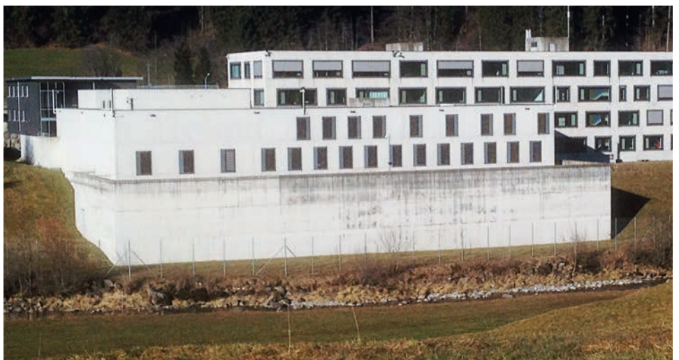
Das Kantonsgefängnis mit den kleinen Fenstern (linker Gebäudeteil) in Biberbrugg mit den drei Haftarten: Untersuchungshaft, Vollzug und Ausschaffungshaft.

Rückblickend waren es für mich äusserst spannende, herausfordernde und bereichernde Jahre mit meinem wöchentlichen Gefängnisbesuchen. Danach war jeweils persönlich Psychohygiene angesagt, damit ich nächstes Mal wieder mit vollen Batterien und mit Zuversicht und Kraft und der nötigen Erdung im Glauben meinen Auftrag erfüllen konnte.