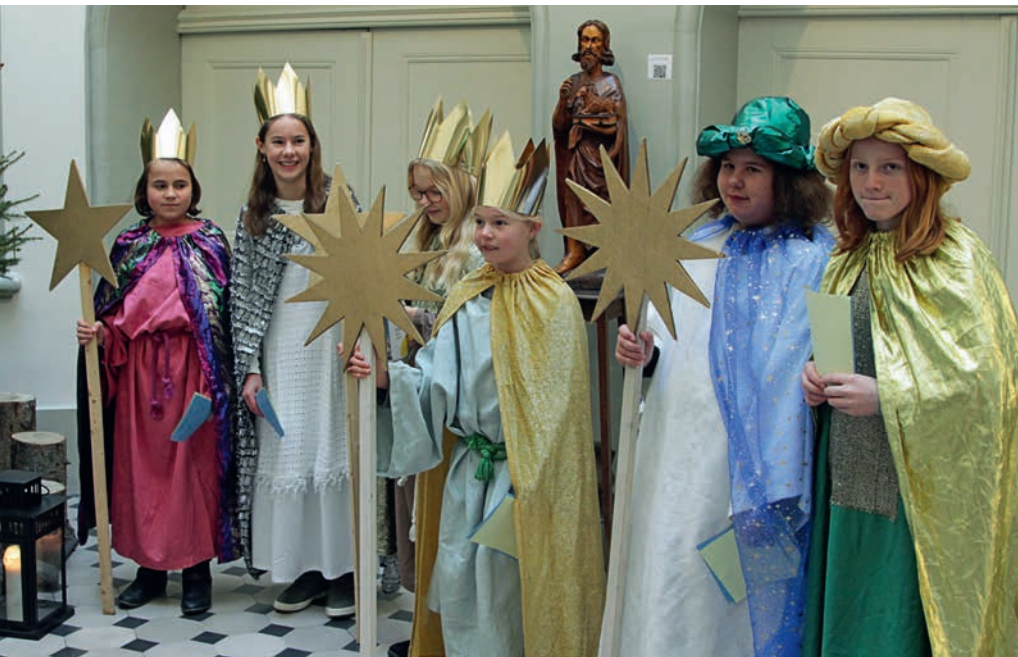
Die Sternsingergruppe aus Tifers berichtet vom weihnächtlichen Frieden und segnet das Bischofshaus in Freiburg.