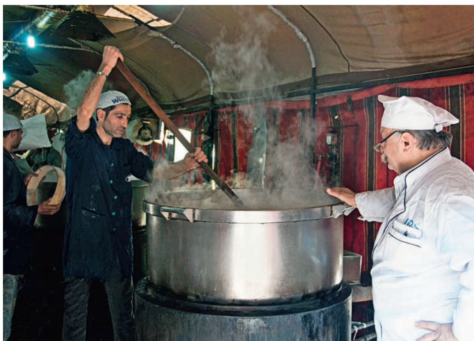
In Grossküchen werden in den Städten Syriens täglich Tausende von Mahlzeiten zubereitet.