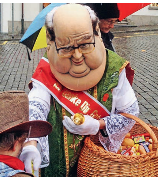
Bei den Schwyzer Grossgrinden figuriert ein bekanntes Seelsoorgesicht

Die Frage, ob man die Fasnacht in die kirchlichen Feiern integrieren kann, wird immer wieder gestellt. Die meisten Pfarrer sagen: In einem gewissen Ausmass auf jeden Fall! Zum Beispiel Narrengottesdienste. Auch «Guggenmusiken» dürfen meiner Meinung nach mit einer gewissen Zurückhaltung durchaus wirken. Ich habe es schon erlebt, dass fast die ganze Pfarreibevölkerung in einem Narrengewand in die Messe gekommen ist und eine äusserst würdige Messe gefeiert hat, das wurde dann auch musikalisch fasnächtlich gestaltet. Es kann natürlich mal Ausrutscher geben oder die Musik kann etwas gar laut sein. Man sucht meistens Wege, dass die Würde der Feier gewahrt bleibt. Aber die Fröhlichkeit darf ein Thema sein und die Menschen dürfen das auch zeigen!