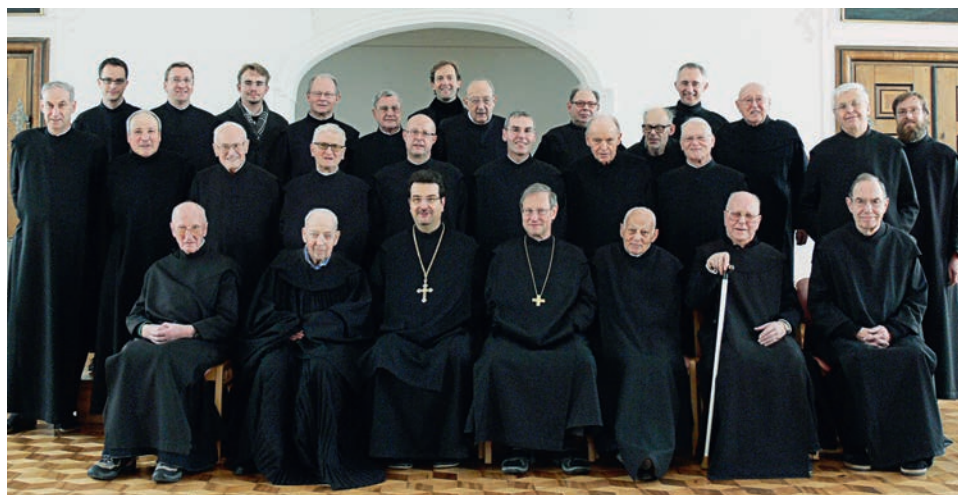
Die Benediktiner des Klosters Engelberg vor einigen Jahren.