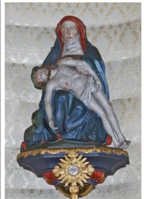
Lachner Gnadenbild: Statue der Schmerzhafte Muttergottes im Hochaltar der Kapelle im Ried.

Neuzuzüger, Auswärtige und Lachner, die mehr über dieses besondere Lachner