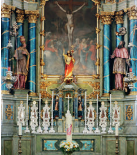
Auferstehungschristus im Hochaltar unserer Pfarrkirche

Die ältere Generation erinnert sich sicher noch gut an die früher oft diskutierte Frage, ob der Karfreitag oder der Ostersonntag das höchste Fest sei. Und als Fazit hielt man fest: für die Reformierten ist der Karfreitag der höchste Feiertag und für die Katholiken der Ostersonntag.