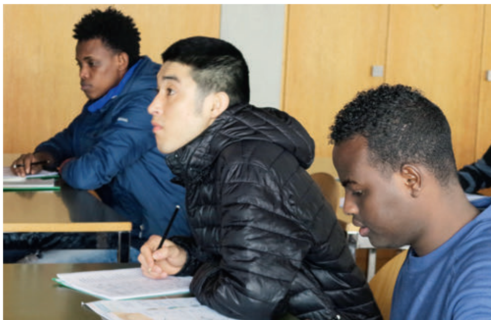
Asylbewerber lernen in Deutschkursen die Schweizer Sprache.

Stefan Frey verhehlt ein gewisses Befremden nicht: «Das Evangelium beschreibt mehrfach, dass man Fremden aufnehmen soll. Auch in der christlichen Tradition wurden Flüchtlinge bislang unabhängig von ihrer Herkunft aufgenommen.» Genau dies sagt auch Markus Büchel, Bischof von St. Gallen: «Meine christlichen Wurzeln, mein Christ-Sein bedeutet für mich, offen zu sein für alle Menschen in Not, egal welcher Staatsangehörigkeit oder Religion.»