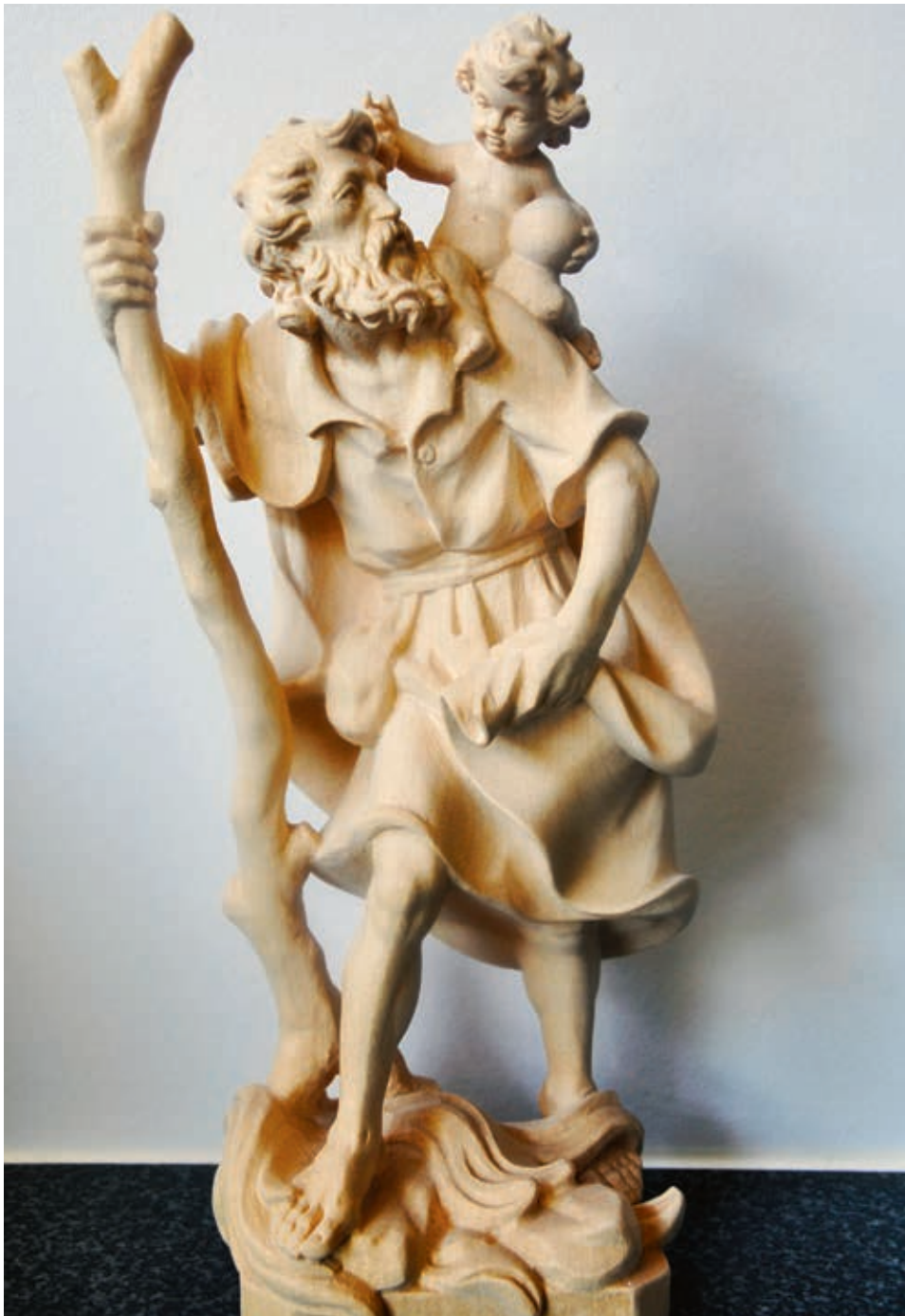
Christophorus, Schutzpatron aller Reisenden und all jener, die sich den Gefahren des Verkehrs aussetzen. Der 24. Juli ist der Gedanktag des Heiligen und das Christophorus-Opfer wird für die MIVA aufgenommen.