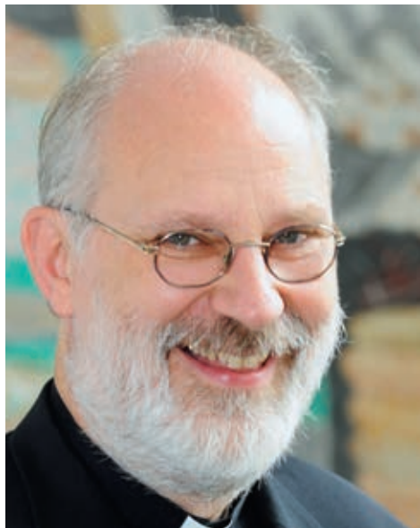
Weihbischof Ansgar Puff.

Ansgar Puff: Weil man ja auch regelmässig seinen Müll aus der Wohnung bringt. Der innere Müll muss irgendwann weg, sonst fängt es an zu stinken. Und die Müllabfuhr ist der Beichtstuhl.