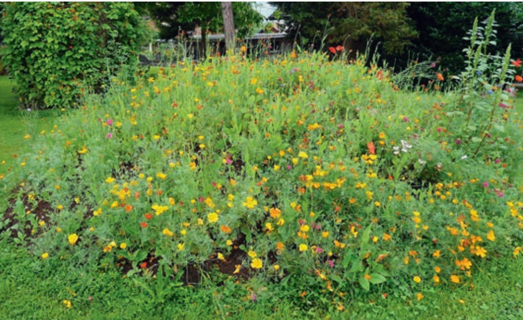
Im Garten des Museums Bruder Klaus Sachseln treibt die Sehnsucht die schönsten Blüten.