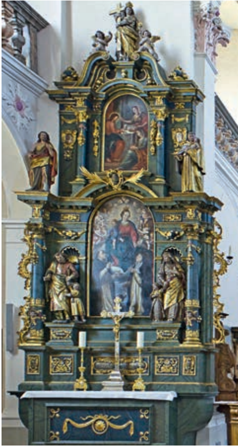
Rosenkranzaltar in der Pfarrkirche Lachen

Auch in unserer Pfarrkirche finden wir ein Bild, das den Heiligen Dominikus zeigt, dem die Gottesmutter einen Rosenkranz überreicht. Dominikus erkannte darin die Antwort auf seine Gebete, mit denen er sich auch an die Jungfrau um Hilfe gewandt hatte, um zu erfahren, wie er die Irrlehre der