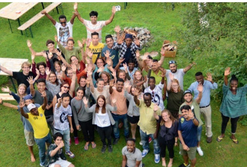
Jugendliche organisieren Freizeitaktivitäten für Asylsuchende.

Caritas passt ihre Angebote diesen Veränderungen an. Gleichzeitig ist es aber auch klar, dass freiwilliges Engagement kein Selbstzweck ist und einen sozialen Nutzen erzeugen soll. Freiwillige erwarten Wertschätzung und eine sinnvolle Aufgabe.