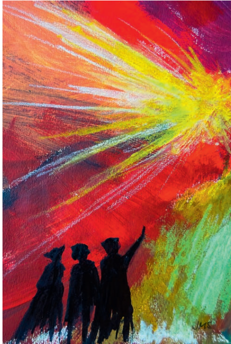
Frontbild «Dem Licht entgegen».

Gottes Licht will in jede Not auf der Welt kommen. Er leuchtet dem unruhigen Baby, dem ausgeschlossenen Schulkind, dem von der riesigen Auswahl geplagten Jugendlichen, dem arbeitslosen Menschen,