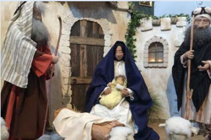
Krippe in der Pfarrkirche Lachen.

«Das Volk, das im Dunkel lebt, / sieht ein helles Licht. Denn uns ist ein Kind geboren, / ein Sohn ist uns geschenkt. man nennt ihn: Starker Gott, / Fürst des Friedens.»