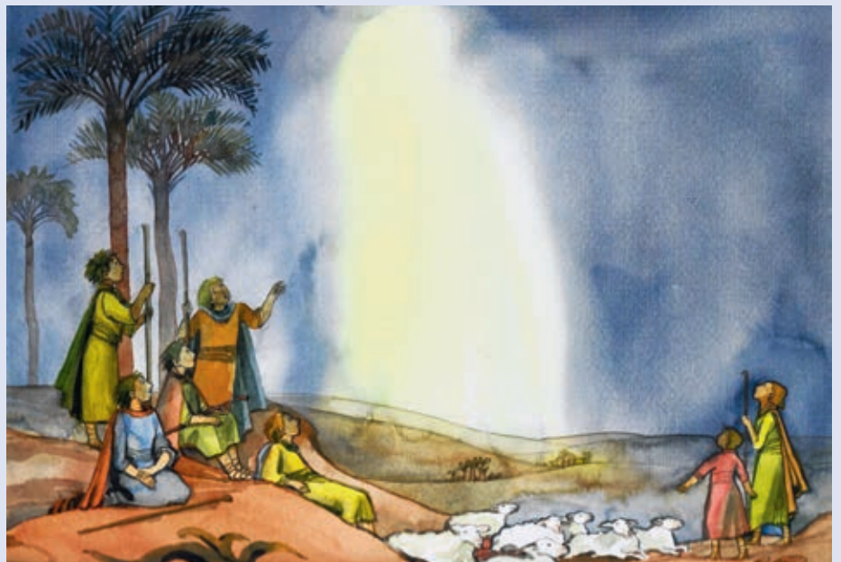
Hirten auf dem Feld bei Bethlehem. Bild aus Andrew Bond/Brigitte Smith: Di allereerscht Wienacht

Alle Sängerinnen und Sänger bedanken sich herzlich für das grosszügige Kirchenopfer vom Christkönigssonntag. Wir freuen uns, auch weiterhin zur Ehre Gottes und zur Freude der Teilnehmenden im Gottesdienst unser Bestes zu geben.