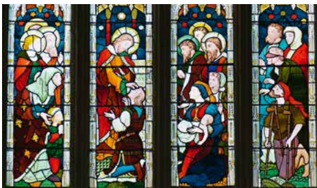
Kirchenfenster mit Heilungen Jesu

In der Schweiz wird der Krankensonntag am ersten Sonntag im März begangen, dieses Jahr also am 7. März. In den Gottesdiensten dieses Wochenendes sind alle älteren und kranken Menschen eingeladen, die Krankensalbung zu empfangen.