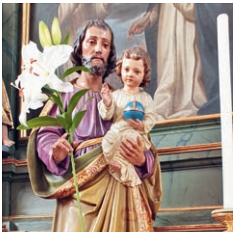
Hl. Josef, Kirche Lachen

Da dieses Jahr der Seppitag auf den 4. Fastensonntag (Lätare) fällt, wird kirchlich der Josefstag erst am Montag gefeiert.