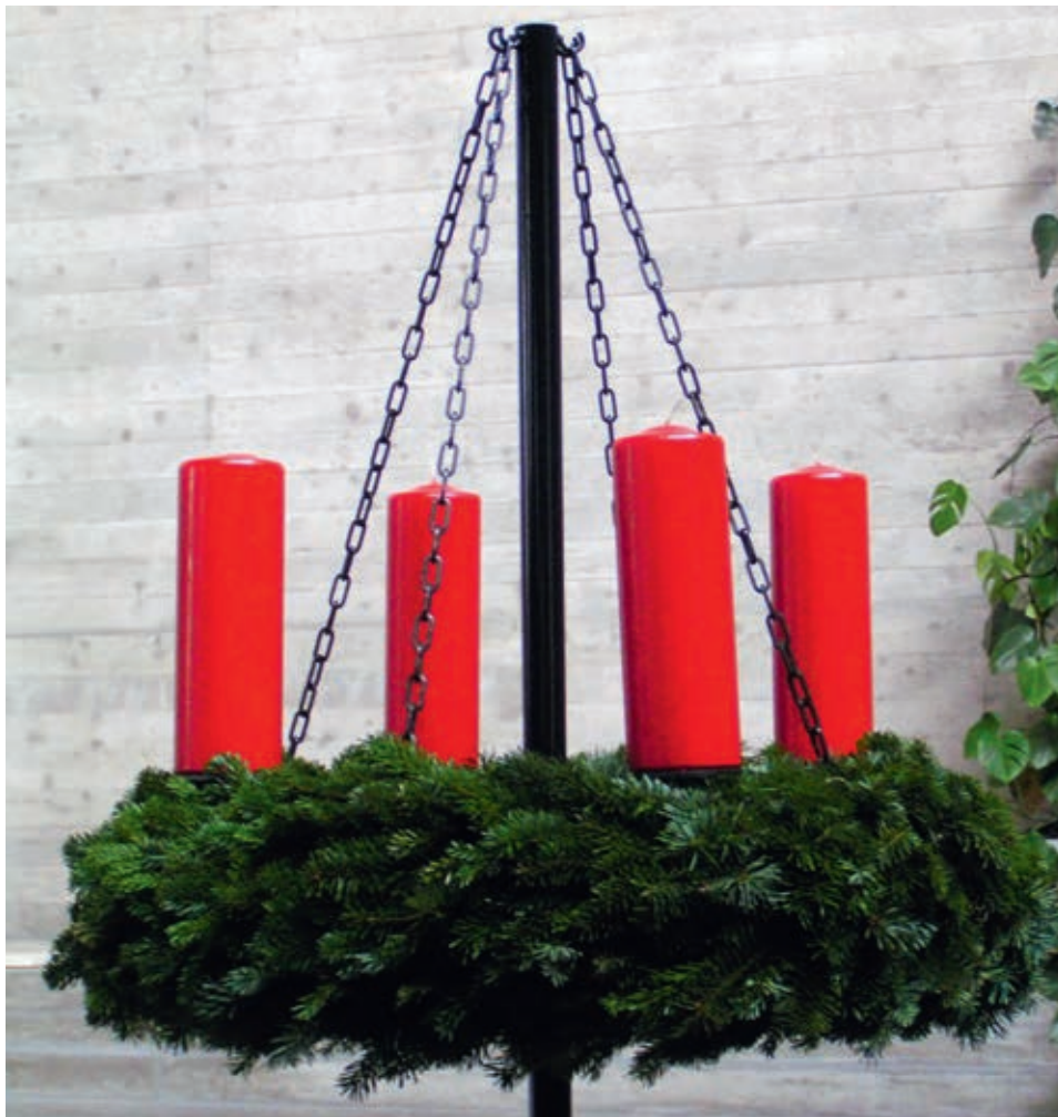
Die vier Adventskerzen künden vom Kommen des Lichts der Welt.