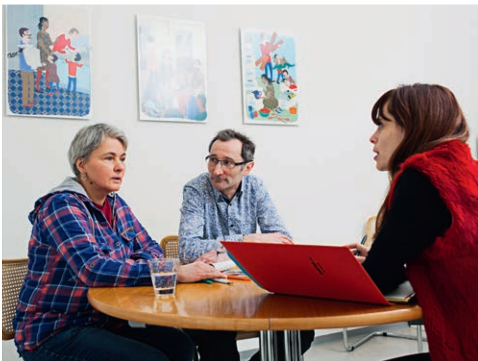
Die persönliche Hilfe muss auf den Sozialdiensten wieder mehr Gewicht bekommen.

Im Rahmen der Globalisierung ist die Schweiz beim Strukturwandel mit an der Weltspitze. Die Schweiz muss diese Dynamik irgendwie bewältigen. Das bedeutet für jeden Einzelnen noch mehr Flexibilität, noch mehr Bereitschaft, immer wieder dazuzulernen. Das hat aber im Alter und in den Kapazitäten seine Grenzen.