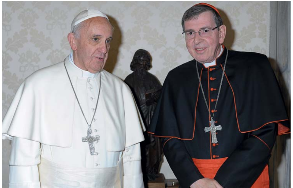
Papst Franziskus und sein «Ökumeneminister» der Schweizer Kardinal Kurt Koch werden in Genf erwartet.

Der Besuch unterstreicht die gemeinsame Vi-