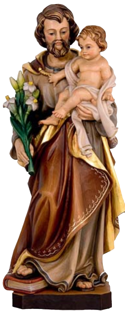
Heiliger Josef mit Jesus und Lilie.

der schweigenden und selbstverständlichen Hilfe und Unterstützung. Ein gehorsamer Mann. Der Mann, in dessen Leben Gott dauernd eingriff mit neuen Weisungen und neuen Sendungen. Er musste immer wieder neu entscheiden und aufbrechen. Ein Mann