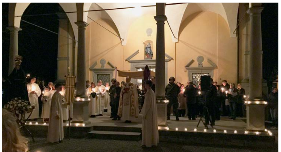
Mit der abendlichen Lichterprozession wird das Kapellfest feierlich abgeschlossen.