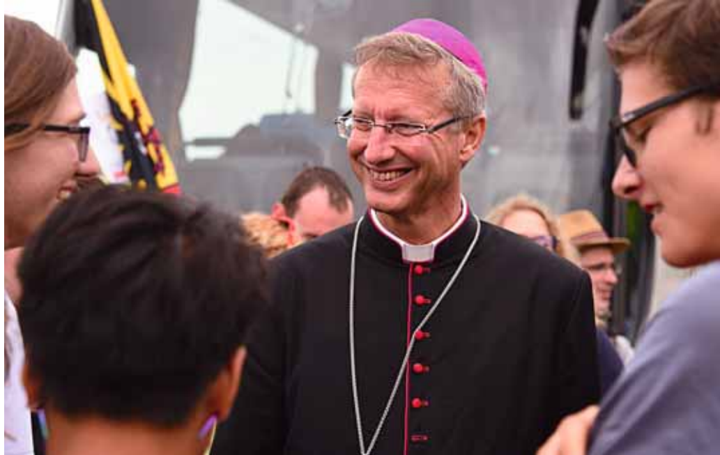
Als beste Vorbereitung für die Jugend-Bischofssynode bezeichnet Weihbischof Alain de Raemy die Begegnung mit Jugendlichen.

heutzutage, der Druck der Social Media, immer vernetzt zu sein. Wir haben in der Schweiz eine hohe Selbsttötungsrate unter Jugendlichen. Dieses Thema kommt im Dokument vor, aber nur sehr kurz.