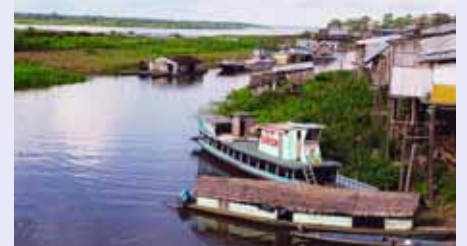
Schwimmende Häuser in Iquitos. Wenn d. Wasser um 3-4m steigt, steigen sie mit.

Merita Flores Púa ist Krankenpflegerin und leitet ein katholisches Gesundheitszentrum im peruanischen Amazonasgebiet. Regelmässig fährt sie in die Dörfer am Fluss zur Gesundheitsförderung.