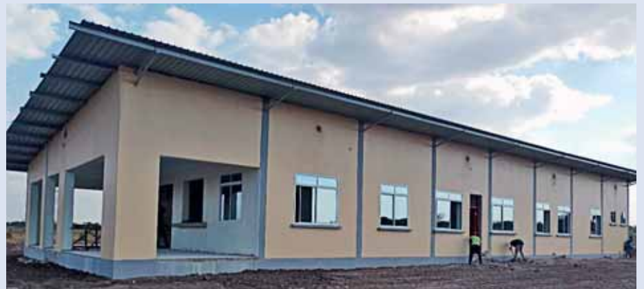
Gesundheitscenter Kisesa in Tansania

Tel: 055 462 10 31 / www.salesan.ch / info@salesan.ch