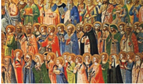
Die Vorläufer Christi mit Heiligen und Märtyrern, Fra Angelico (1423-24).

Die Totengedenkfeier an Allerheiligen beginnt um 15.00 Uhr in der Pfarrkirche. Wir gedenken aller unserer lieben Verstorbenen, besonders auch jener, von denen wir seit Allerheiligen 2019 für immer Abschied nehmen mussten.