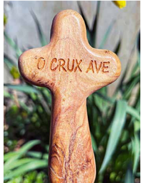
Holzkreuz «O Crux Ave».

O heiliges Kreuz, unsere einzige Hoffnung, wir grüssen Dich! «Durch Seine Wunden