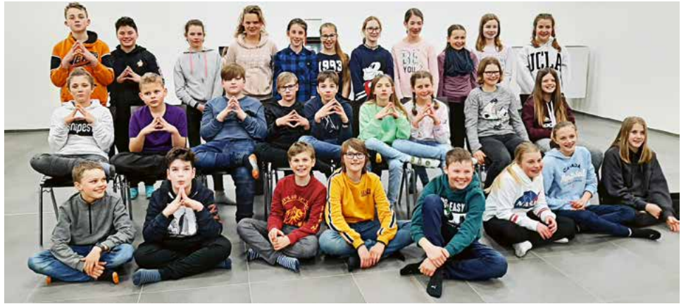
Für 6 Firmgruppenstunden trafen sich die Firmanden/innen jeweils im Pfarreisaal.